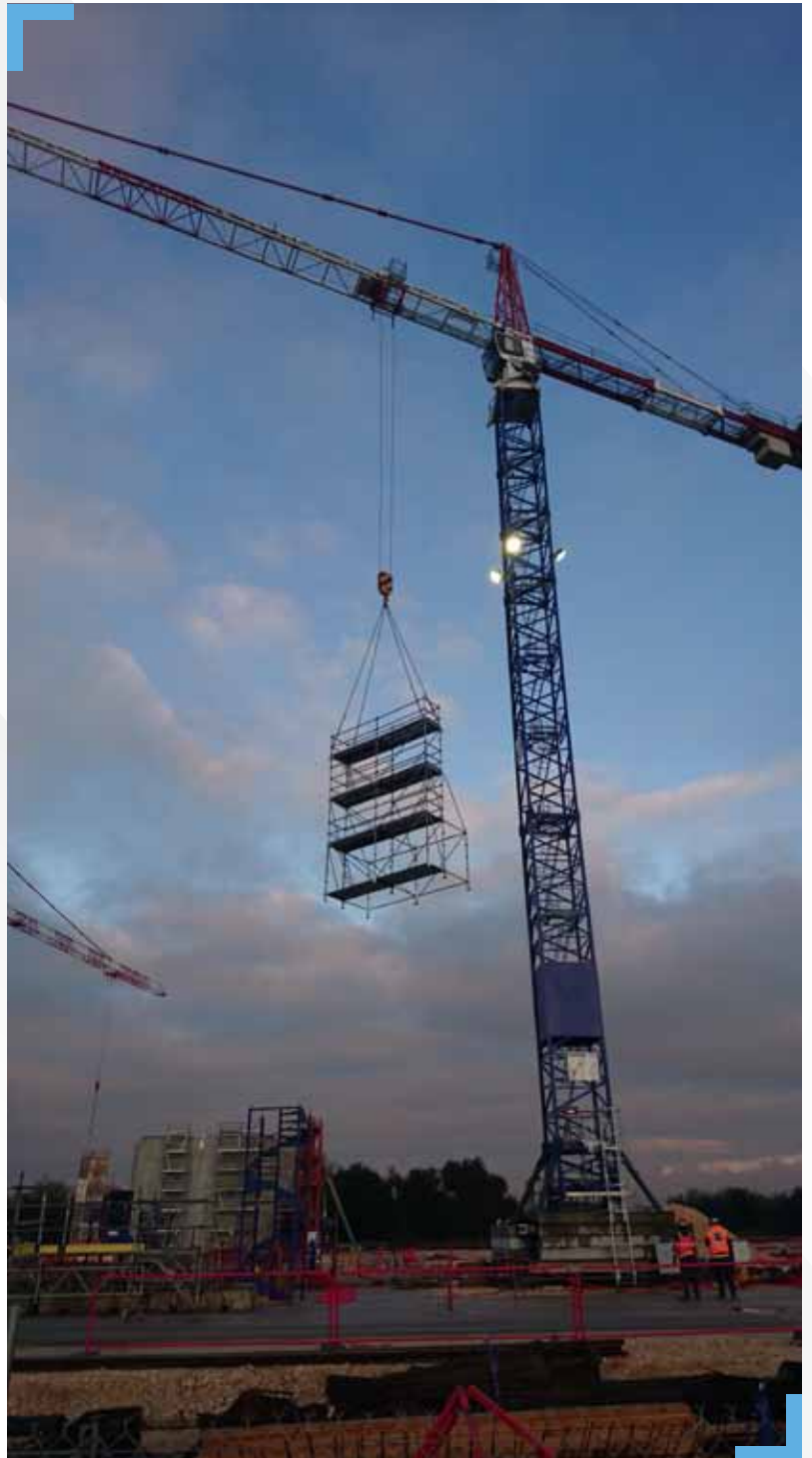
Exemple échafaudage de ferrailage avec arrière-structure